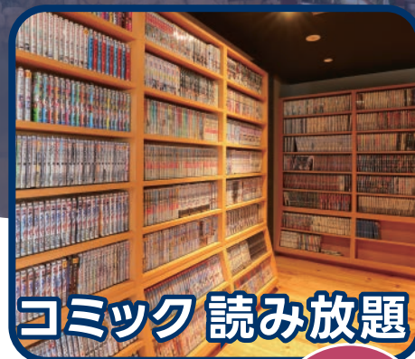
コミック 読み放題